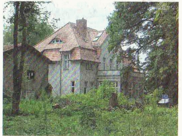
Sabersky-Villa in Teltow-Seehof, heute Ärztehaus.