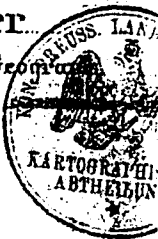
Abb. 5 Urmetrischblatt M 1:25.000, bearb. 1874

Dienstl. Ingenieur. Geom. Revidirt durch